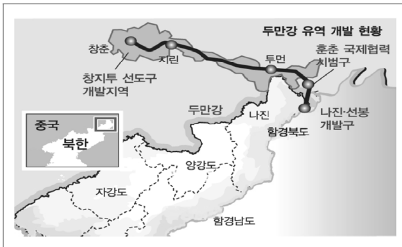
[그림 2] 중국 지린성 두만강 유역 개발 현황: 창지투 선도개발지역과 훈춘 국제협력 시범구

자료: 아주경제, <창지투의 거점 지린성> 새로운 경제 중심지로 부상하는 지린성, 2012.6.18